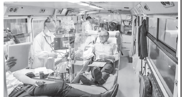
今年も多くの関係者が協力

「地元地域の皆さまへの恩返しの意味を含め、弊社が日頃から力を入れている社会貢献活動の一環として毎年4月7日に行っている献血会も今年で7回目を迎えることができました。これも皆さまのご協力あつてのことです。来年の4月7日も開催する予定です。ご協力の程よろしくお願ひいたします。」と、誠にありがとうございます。現在ではスマホアプリ「ラブラッド」で手軽に献血できるのでも、ぜひとも協力を。