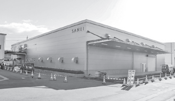
岐阜新工場棟(組立工場)外観

【熊本営業所概要】 所在地 〒869-0053 熊本県宇城市松橋町久員1296-1 TEL 096-4888-881 FAX 096-4887-1 営業開始日 2026年1月5日