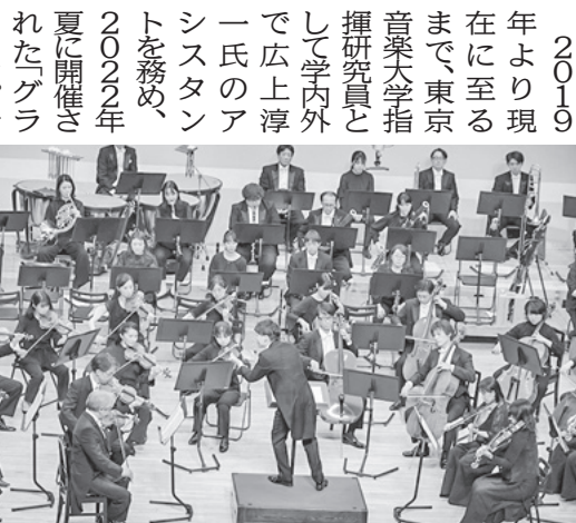
演奏：セントラル愛知交響楽団

ユーベルトの交響曲第7番短調D759、未完成「ペートル・ウエンの交響曲第5番短調Op.67」「運命」を松村氏が指揮し、会場から大きな拍手が送られた。