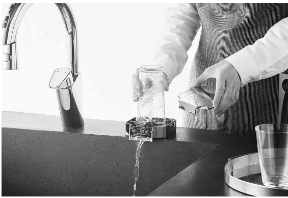
「プレパシユト」使用イメージ