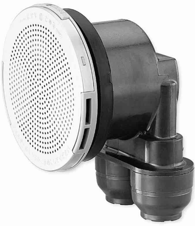
ダブルロックジョイント内蔵型

「JF series」について、技術的な問い合わせは同社お客様相談窓口▽通話無料のフリーダイヤル(0120)1218585へ。注文は全国の各営業所へお問い合わせを。同社ホームページに詳しい製品情報を掲載中。ぜひアクセスを。