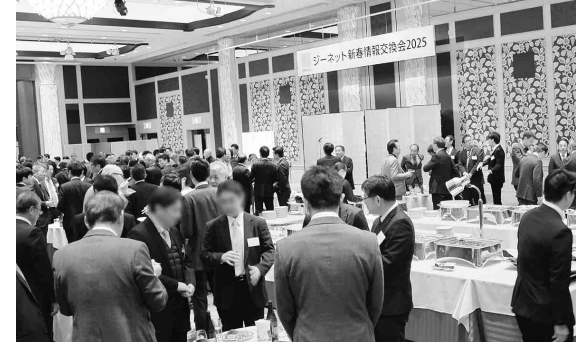
製販が一室に会して交流