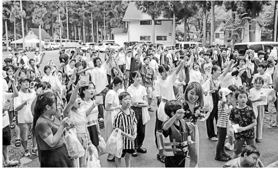
一時的に雨があがり入村式を無事開催