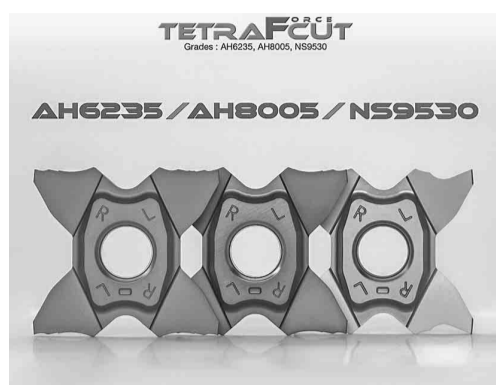
TETRAFCUT Grades: AH6235, AH8005, NS9530 AH6235 / AH8005 / NS9530

専用超硬母材を組み合わせ、驚異的な耐摩耗性を表現しており、高速加工でも安定した長寿命が得られる。一方の「AH6235」材種は、高硬度のチタン高含有ナノ積層膜を外層膜に採用し、高靱性超硬母材との組み合わせで、断続加工や突切り加工でも安定した長寿命を実現