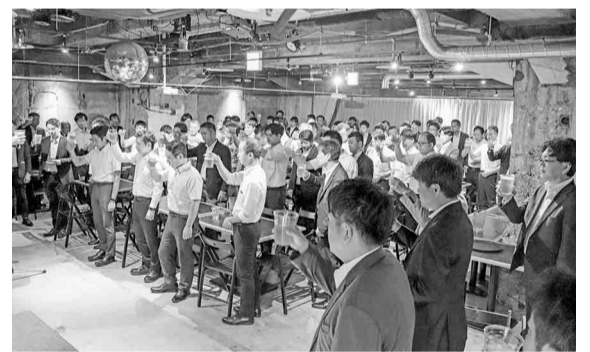
展示会の成功を祈願し乾杯

【各部報告】●総務部会 2025年新年賀詞交歓会は、名古屋市中村区の名古屋マリOTTアソシアホテルで2025年1月22日の開催が予定されている。次回理事会までに開催概要を検討すること。●福利厚生部会 巡回健康診断は7月2日・同30日の期間中6社の巡回が完了。同組合の今後の理事会日程は以下の通り。●11月5日▽組合事務所。●2025年1月22日▽名古屋マリOTTアソシアホテル。●3月4日▽組合事務所。