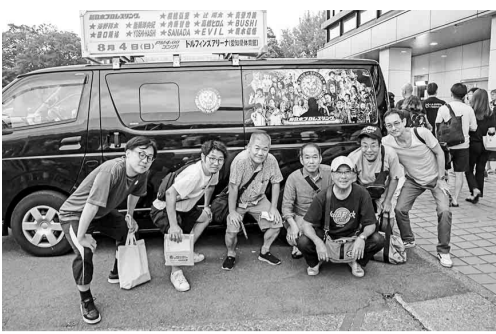
観戦後に記念撮影

8月4日、「新日本プロレス」の試合を観ようの会を開催した。当日は、名古屋市中区の愛知県体育館(ドルフィンアリーナ)で行われた『ヤマダインフラテクノス Presents