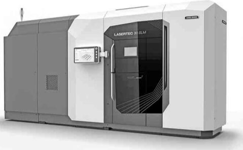
LASERTEC 30 SLM 3rd Generation

従来の最大積層容量を1.5倍アップした。また、最大1000Wの出力を最大4台まで搭載でき、より高速に積層造形を行えるようになった。