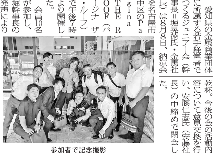
参加者で記念撮影

また、積層時に使用したパウダーや不活性ガスを「rePLUG」内に搭載された超音波ふるい分け装置やフィルタシステムによって効率的に回収するため再利用が可能で、循環型社会の実現にも貢献する。本体価格は1億3130万円(税抜)。「LASERTEC 30 SLM 3rd Generation」は、11月5〜10日に東京ビックサイトで開催されるJIMTOF2024に出展される。