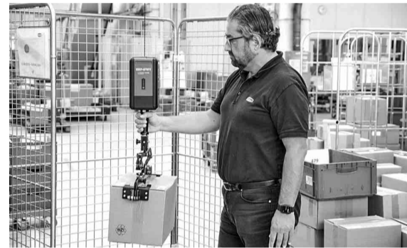
段ボール箱を両側から挟んで運搬

ルから手を離すと装置が固定され、任意の位置で作業が行える。標準品のフックのほかにも多種多様な機械式