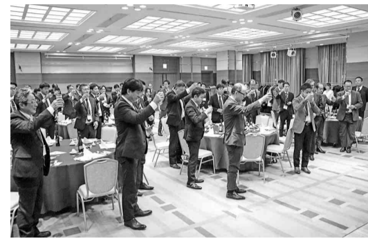
新年の挨拶を交わし乾杯

が問題視されており、我々の業界でも懸念される点があります。そのうち、今年も、今までコロナ禍で地道に皆さんが準備されてきたこと、活動してきたことが今年の実となり、成果に結びつく年であり、また、新しいことに挑戦して成功を収める期待の持てる1年でもあると思います。私もメーカーは、正会員の皆さまと一体となつて、この地区の業界の発展に精一杯お力添えさせていただきます」と挨拶を述べた。