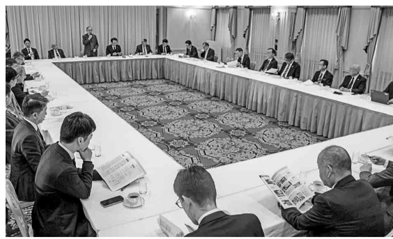
第2回実行委員会の様子

RTJは、製造現場や物流拠点、研究所などで使用される産業用ロボットと自動化システムに特化した展示会で、産業の集積地である「中部」で開催される。初開催となった前回2022年展には、202社・団体が1096小間に出展し、3日間(4万1880人)が来場した。