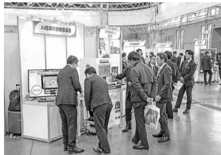
ユーザーと直接話し課題や問題点を正確に把握