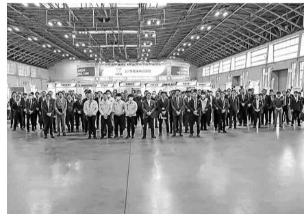
開場前、出品者には気合が漲っていた