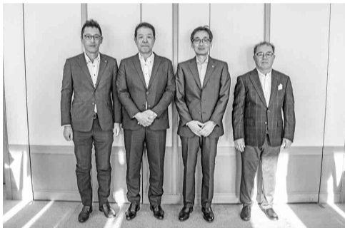
左から、石原氏(3位)、高橋氏(優勝)、木下社長、水谷会長(準優勝)