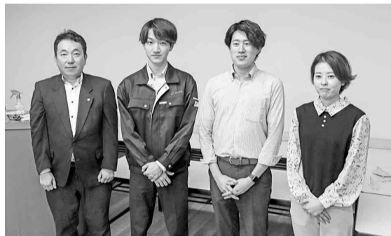
岩田理事長(左)と上位入賞者