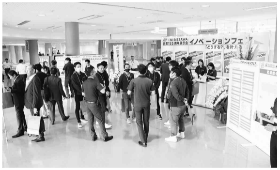
3000名近く来場し大盛況

お時間をいただける貴重な時間、場であります。私たちが精一杯この機会を活かして今後の販売活動に繋げていけるよう尽力してまいります。皆さま方のご支援、ご協力をお願い申し上げます」と挨拶した。