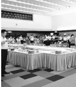
東副委員長の音頭で乾杯

非常な嬉しく思います。当初予定していた以上に活発に皆が意見を出し合う事ができ、打ち合わせをするたびに一体感が強くなったと思えます。私は今回で任期満了となりますが、今後の組合が部署、世代の垣根を超えた交流を通して新たな考えや意見を浸透させ、今まで築き上げてきた事をより良くしていく、その様な事を積み重ねていく組織として存在感を出していってほしい」と述べています。