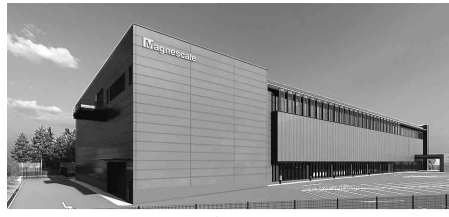
マグネスケール奈良事業所の完成予定図