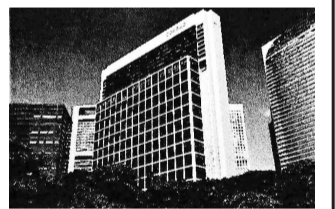
移転先の東京汐留ビルディング(中央)

【業務開始日】本社(幕張) 在籍部門=2023年11月27日(月)▽日本橋事務所在籍部門=2023年12月4日(月) なお、移転準備のため本社(幕張)は11月22日(水)、日本橋事務所は12月1日(金)の営業時間を午後3時までとする。11月24日(金)は通常営業。