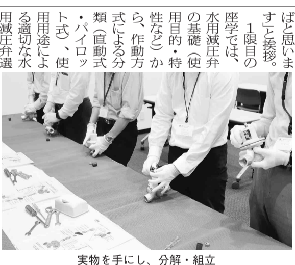
実物を手にし、分解・組立

は創業から155年が経過いたしました。これからはさらなる新たな歴史を作っていく第一歩になるよう2日間全力で取り組んでまいります。皆さま方のご支援、ご協力をお願い申し上げます」と挨拶した。