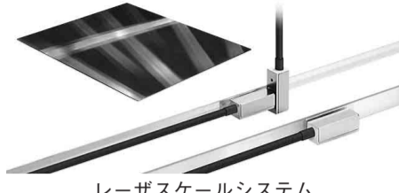
レーザスケールシステム

治氏、本社=東京都江東区、奈良県奈良市と大和郡山市にまたがる1万3200㎡の土地にレーザスケールの生産工場を建設すると発表した。2025年5月の完成を目指す。