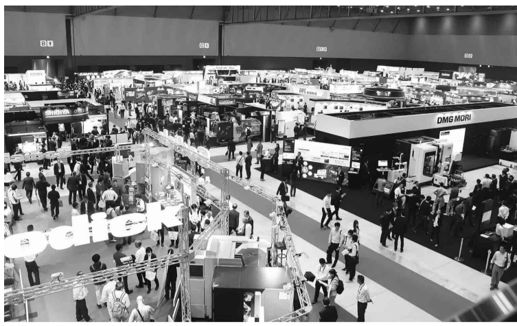
多くの工作機械と来場者で賑わう会場 (新第1展示館)