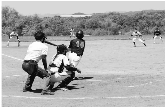
中央工機対ユアサ商事戦の一場面