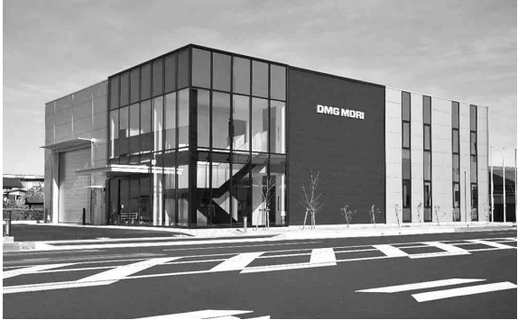
「DMG MORI ACADEMY 浜松」外観