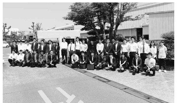
プロテリアル桑名工場正門前で

史や、長年愛され続けているひょうたんマークの由来、同社が手掛ける継手やバルブ以外の商品(機器など)についての解説もなされた。