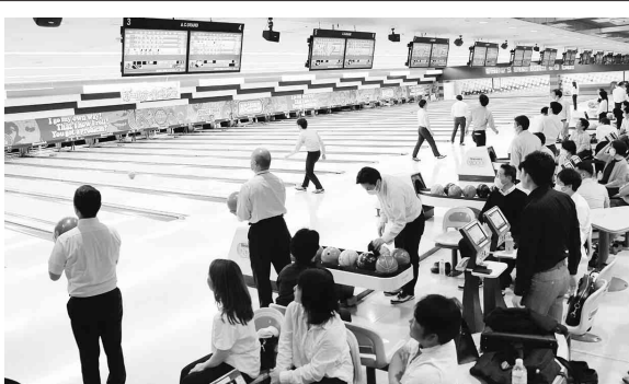
4年ぶりに開催され大盛り上がり