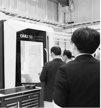
5軸加工機 DMU 50 3rd Generation 見学の様子

同社ではこれまでも製造業全体の若手技術者育成と、顧客のNC機械導入時の立ち上がりをスムーズにすることを目的として、東京都江東区、三