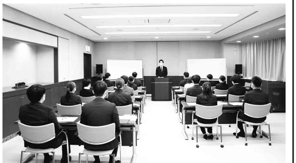
研修の様子 新入社員は はじめ入社1年 前後の社員を 対象に、社会 人、組織人とし ての意識づけ から生産性