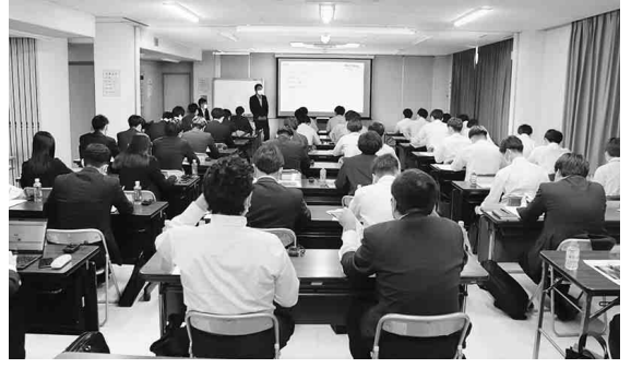
熱心に商品知識を学ぶ参加者

限目では、プロテリアル商品を中心とした「管継手類」について、継手とは何なのか? その役割などのほか、プロテリアルや他メーカーを含め継手にはどんな種類があるのか? その用途やメリット・デメリットも併せて学習した。また、日立金属から社名変更したプロテリアル創業からの歴史