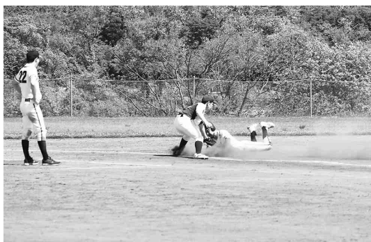
ミスタ二機販対落合戦の一場面