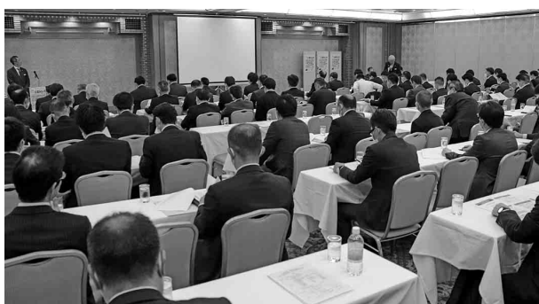
中部みらい会総会の様子

【議案1】第17期(令和4年4月1日)〜令和5年3月31日) 活動報告。 【議案2】第17期会計報告/監査報告。 【議案3】第18期(令和5年4月1日)〜令和6年3月31日) 事業計画。同会の本年度事業予定は以下の通り(4月28日現在)。 ●当日▽中部みらい会総会ならびに中部・静岡みらい会合同方針説明会 ●6月17日(土)▽2023三重みらい市(メッセウイングみえ) ●10月12日(木)▽みらい会全国合同総会(ホテルニューオータニ) ●同13日(金) 14日(土)▽東京みらい市(東京ビックサイト東2・3ホール) ●10月▽中部みらい会実務責任者会(名鉄ランドホテル) ●10月27日(金)▽中部みらい会親睦ゴルフ会(名古屋ゴルフ倶楽部和台コース) ●令和6年3月▽中部みらい会幹事会(名鉄ランドホテル) ●2023年度▽製販懇談会(各地区会場、シヨールム商談会(各地区))