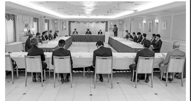
組合員・木曜会メンバーら25名が出席

【第3号議案】実務責任者会議(木曜会)報告承認の件 2022年度事業報告ならびに収支決算報告、2023年度事業計画ならびに収支予算(案) 同組合理事会の下部組織にあたる木曜会に組合員名簿の確認等。