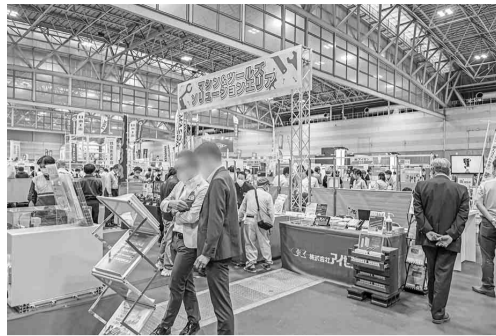
昨年の展示会風景