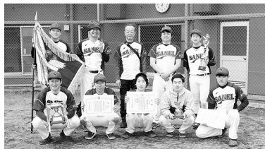
Bゾーン準優勝・三栄商事チーム