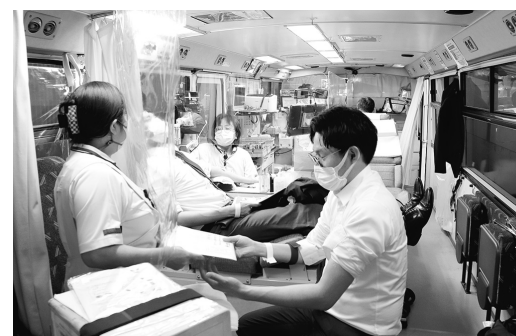
この機会に献血について考えてみては

始めたのがこの献血会です。今回でようやく4回目ですが、また来年もそして再来年も続けていき、微力ではありますが社会に貢献できればと思っています」とは同社のコメント。