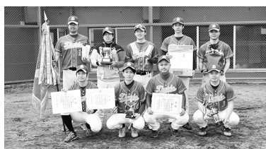
Aゾーン準優勝・ダイドールチーム