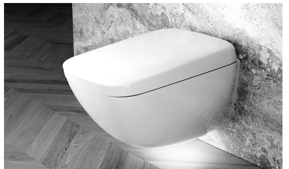
ウォシュレット一体形便器「ネオレストWX」

べり台のような傾斜が設けられている。タッチレスの「きれい除菌水」生成器は、センサーに手をかざすと除菌効果のある水をミスト状で噴霧。タッチレスなので水栓も汚しにくく、いつでも手軽に清潔を保てる。