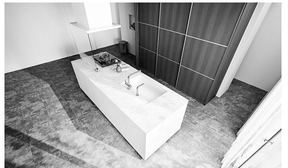
システムキッチン「THE CRASSO」

れを放置してもシミになりにくく、簡単な手入れでキッチンのきれいを保てられる。「スクエアすべり台シンク」は、水や野菜ゴミがスムーズに流れるよう、シンク底面、網カゴ、排水口にす