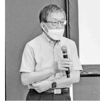
阪田橋本総業社長

してきましたが今回の中部、東京、そして関西を残すのみとなりました。この2日間のみらい市の目標達成に向けてぜひともご協力をお願い申し上げます。」