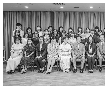
2022年度奨学金給付認定証授与式

は、在学する大学からの推薦を受け、選考委員会の審査を経て決定された学生56名。今年度分を含めこれまで延べ500名以上の学生が給付を受けている。 2022年度奨学金給付認定証授与式は8月5日午前11時より名古屋駅前の名鉄グランドホテルで開催され、学生に奨学金の目録が手渡された。 田中代表理事は冒頭の挨拶で、財団を設立した山田貞夫氏(現会長)が少年時代、母親を失い父親とも離れて過ごしていた頃、友人宅で聴いたベ