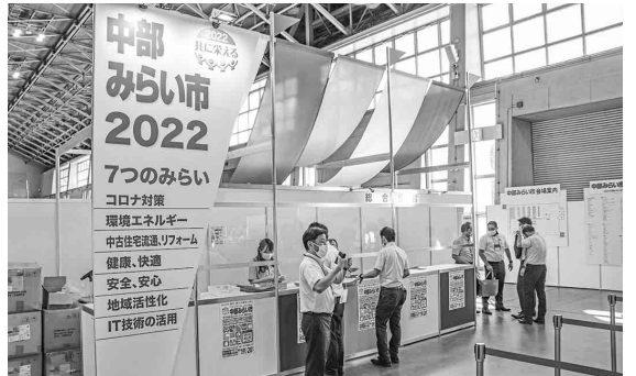
今回展から受付デザインが一新

してきましたが今回の中部、東京、そして関西を残すのみとなりました。この2日間のみらい市の目標達成に向けてぜひともご協力をお願い申し上げます。」