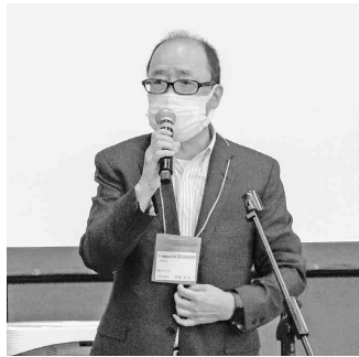
伊藤中部みらい市会長

19日に開催されたオープニングセレモニーでの伊藤中部みらい市会長挨拶「中部みらい市はコロナ禍のなかで3回ほど延期を余儀なくされてきました。今回やっと開催できたわけですが、感染症対策を充分講じたうえで、やるべきことをやっていくというのがこれからのスタイルではないかと思えます。我々の業界ではもうひ