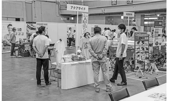
カフェ・アクアサイド (一宮市) にぜひお立ち寄り